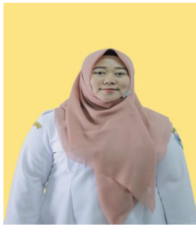
SAHRI RAHMADANI PRAMU KANTOR