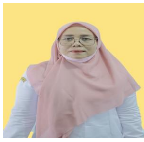
ELVI ASIH SEKRETARIAT LKKS