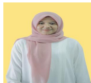
NISA NULIA NITA SEKRETARIAT P2TP2A