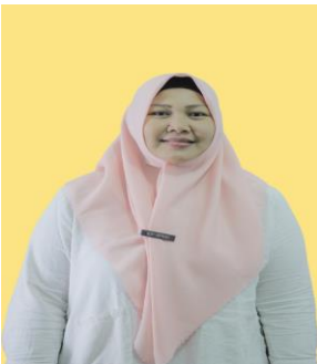
NERY HEFRIANI KEBERSIHAN KANTOR