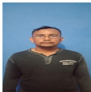
SUEDRI CAN PENJAGA KANTOR